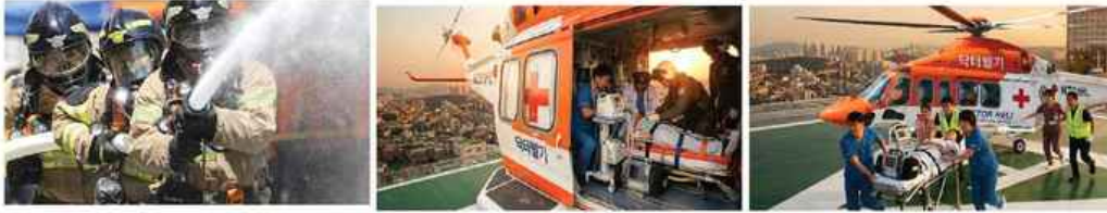
가사: 무궁화 삼천리

컷 바뀌면 소방 호스를 들고 달려나가는 소방관 고속촬영 컷으로 분위기가 전환되고 다다다다 응급헬기의 프로펠러 돌기 시작, 긴급 환자의 이송, 다급한 의료진의 진지한 얼굴,