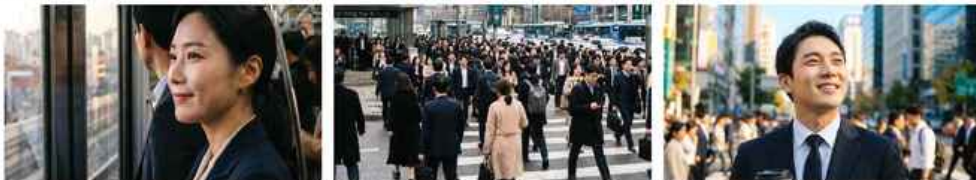
지하철 출근하는 직장인 얼굴, 횡단보도 바쁘게 건너는 사람의 얼굴, 문득 고개 들어 긍정의 표정을 짓는 클로즈업으로 엔딩