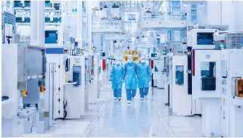
가사: 동해물과 백두산이

반도체, 조선, 자동차 등 산업의 현장에서 그리고 새벽 4시 5분에 출발하는 6411 버스로 출근하며 동해물과 백두산이 마르고 닳도록 땀흘려 일하는 사람들, 다름아닌 나와 우리들 일상의 얼굴을 애국가 1절의 표정으로 포착합니다.