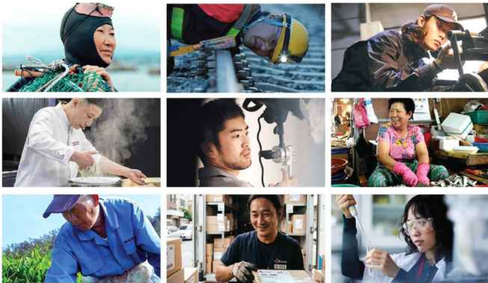
물에 들어가는 해녀의 얼굴, 선로 안전을 점검하는 지하철 노동자의 얼굴, 선반 기계 작업에 몰두한 얼굴, 짜장면 수타로 뿜는 셰프의 얼굴, 조명을 켜는 사진관 사장님 얼굴, 단골을 반갑게 맞는 시장 아줌마 얼굴, 자식 같은 농작물 살펴보는 농부의 얼굴, 바쁜 움직임의 택배 기사님 얼굴, 연구에 몰입 중인 바이오 연구원 얼굴이 킁킁 빠르게 편집되고