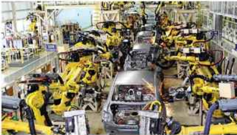
가사: 하늘님이 보우하사

밤새 환하게 불을 밝힌 조선소 전경에서 카메라 들어가면 불꽃과 싸우는 용접사의 얼굴로 천천히 클로즈업