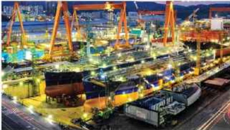
가사: 마르고 닳도록

반도체 공장 생산 라인에서 시작된 화면이 작업 공정을 따라 이동하다가 진지하게 몰두한 표정을 클로즈업