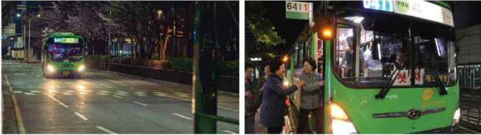
새벽 버스정류장 저 멀리서부터 다가오는 첫 차의 헤드라이트, 매일 보는 익숙한 얼굴들의 인사 클로즈업