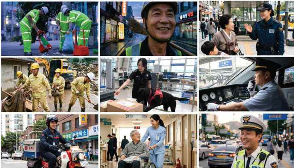
가사: 화려 강산 대한 사람 대한으로 길이

새벽 거리 청소를 마친 환경미화원의 땀에 젖은 얼굴, 길을 잃은 할머니를 돕는 여자 경찰의 친절함 표정, 수해 현장 복구에 여념 없는 공무원들, 마약탐지견과 함께 일에 몰입한 공항 세관원의 얼굴, 안전 수신호를 확인하고 출발하는 철도기관사의 얼굴, 주민들과 밝게 인사하는 우체국 집배원의 환한 표정, 환자의 휠체어를 밀어주는 간호사의 따뜻한 미소, 아이들을 안전하게 건너게 돕는 교통경찰 아저씨의 사람 좋은 웃음이 컷컷빠르게 편집되고